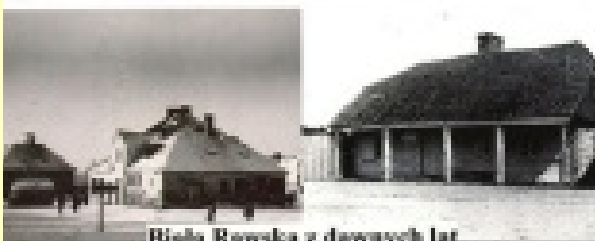
Biała Rawska z dawnych lat