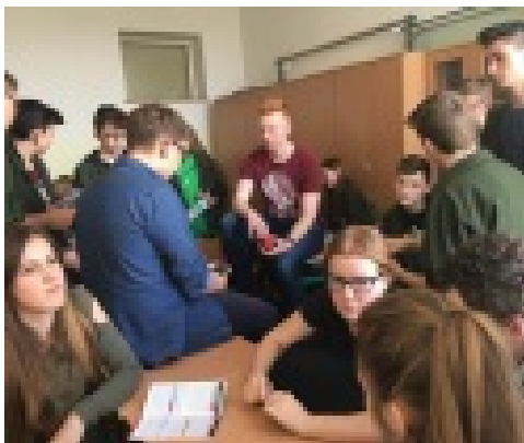
Odwiedziny Kazików w Gimnazjum w Strzebinu

musiałam je opanować. Najpierw zaczęliśmy rozmawiać, przypominając imiona, później nauczyliśmy się o literce „ w”. Nauczyłam dzieci wierszyka o wiosnie i piosenki. Byłam w szoku że tak szybko się nauczyły. Później uściski, pożegnanie i na koniec krótki wywiad redaktora ze mną. Ogólnie niesamowite przeżycie, super przygoda. Nauczyłam się, że bycie wychowawcą w przedszkolu to nie taka prosta sprawa, jak myślałam . Nie tylko zabawa, ale mnóstwo obowiązków. Wiem na pewno, że żeby zostać przedszkolanką, trzeba kochać dzieci, uwielbiać się z nimi bawić, uczyć, mieć bardzo dużo cierpliwości i być szczerym w tym, co się robi, bo one od razu wyczują to, czy nie zachowujesz się wobec nich sztucznie, czy jesteś w to całkowicie wkręcony.